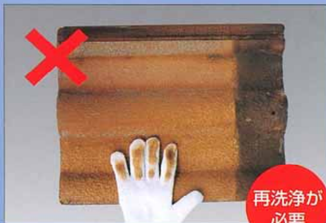
色粉が多く付着する